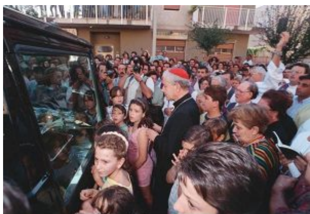
funerali pino puglisi

Ricordiamo san Paolo: « Bisogna infatti che egli regni finché non abbia posto tutti i nemici sotto i suoi piedi. L'ultimo nemico ad essere annientato sarà la morte, perché ogni cosa ha posto sotto i suoi piedi ». (1 Cor 15,25-27). Anche per P. Puglisi i mafiosi hanno pensato la stessa cosa: "uccidiamolo e lo faremo tacere"! Ma hanno avuto corta memoria: non hanno ricordato che il sangue degli innocenti uccisi grida più della loro voce di quando erano in vita, come dice un Padre della Chiesa.