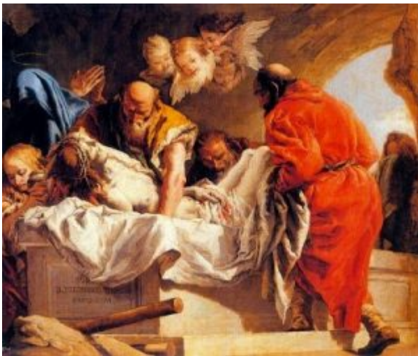
La Sepoltura di Cristo di Tiepolo